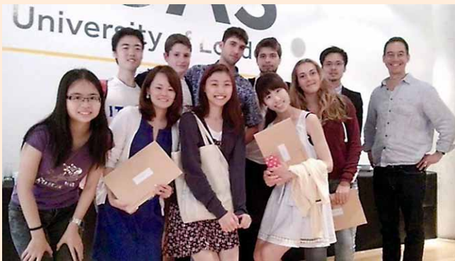
筆者（前列左から2番目）